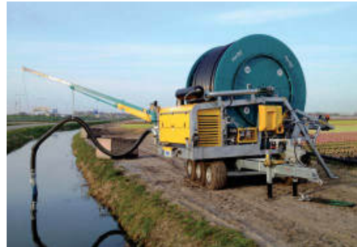
GHB INCORPORATA / INCORPORATED GHB / GHA ENCORPORÉS

L'exigence de optimiser les couts de gestion et de réduire les temps techniques pour les déplacements des machines, ont amené à la création du Ferborain avec group motopompe incorporé sur son châssis. Cette solution permet d'aspirer l'eau directement du canal à côté du terrain ou de conduites en pression bas et medium (Version relance pression). Nous avons à disposition en outre tous les accessoires plus communs et des solutions personnalisées qui ont permis à notre FerboRain "incorporé" d'être entre les réalités les plus appréciées du marché.