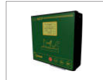
Centralina EasyMOP EasyMOP control panel Boîte EasyMOP