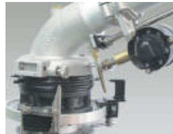
Rotor kit Rotor kit Rotor kit