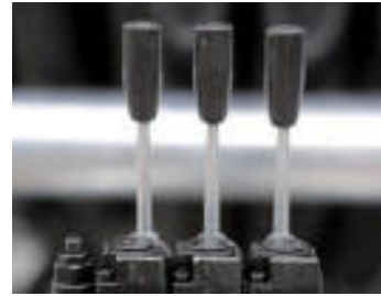
Kit idraulico Hydraulic kit Kit hydraulique