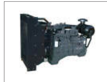
Motore Engine Moteur