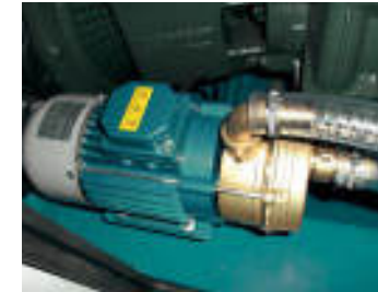
Elettropompa di adescamento Electric priming vacuum pump Pompe auto-aspirant électrique