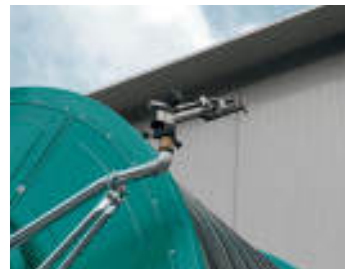
Kit secondo irrigatore sul telaio Second sprinkler on the machine frame Deuxieme canon sur châssis