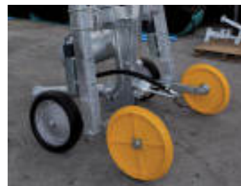
Carrello HP con ruote in ghisa HP trolley with cast iron wheels Chariot HP avec roues en fonte