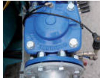
Idrovalvola di ingresso Hydraulic inlet valve Vanne hydraulique à l'entrée