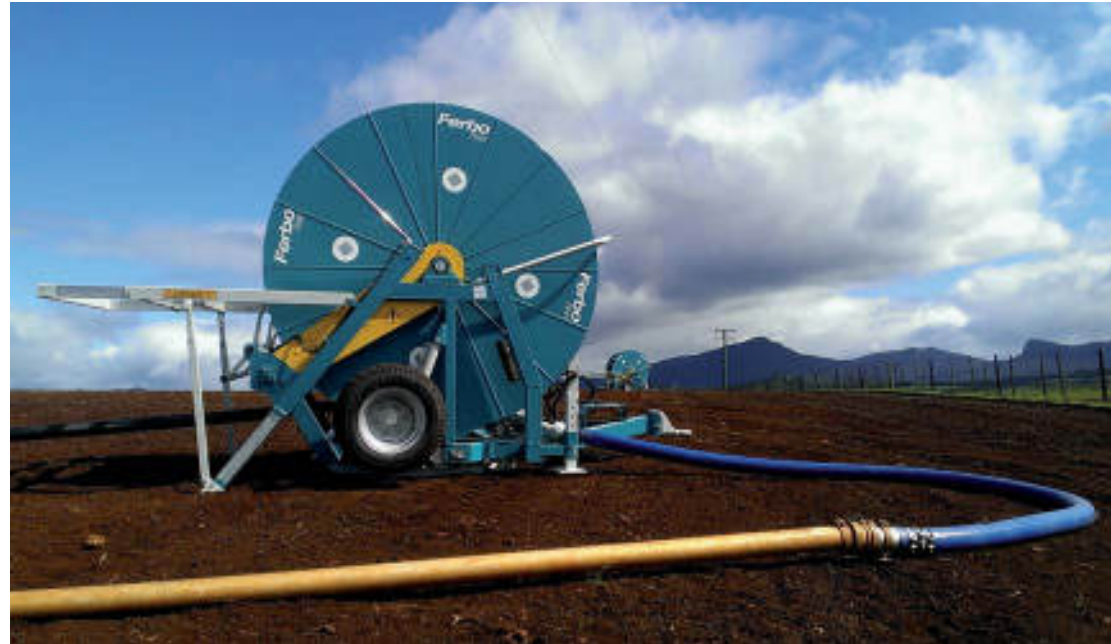
SERIE / SERIES / SÉRIES