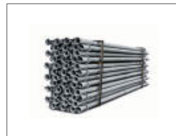
Tubi in acciaio zincati Galvanized steel tubes Tubes en acier galvanisé