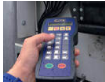
Radiocomando Radio control Radiocommande