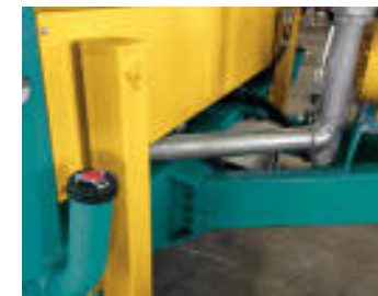
Doppio piedino, doppio rabbocco Double staker leg, double filling point Double béquille, double goulotte de remplissage