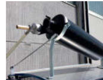
Disp. adescamento in depressione Self-priming device vacuum operated Dispositif auto-aspirant en dépression