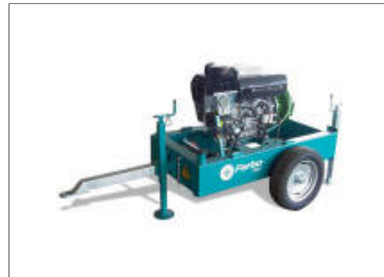
Motopompa aperta 2/4 cilindri 2-4 cylinders motor pump 2-4 cylindres motopompes