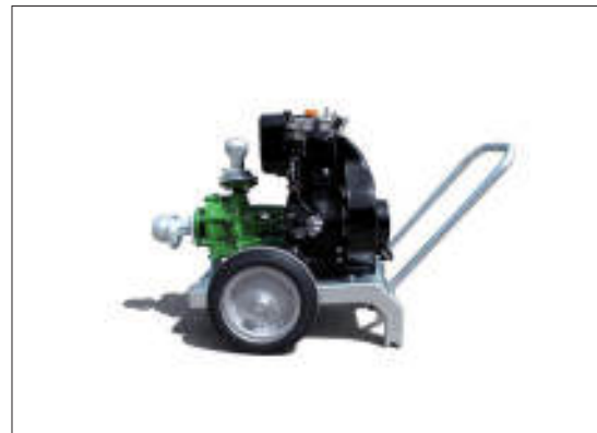
Motopompa monocilindrica Single cylinder motor pump Monocylindriques motopompe

Nous arrivons à garantir la compacité du produit, grâce à la combinaison des moteurs Lombardini-Kohler avec la gamme bridée de pompes Rovatti.