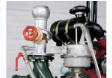
Pompa di adescamento manuale Manual self-priming pump Pompe d'amorçage manuelle