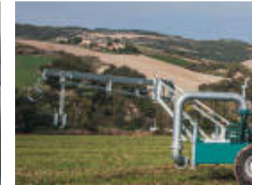
Bandiera porta aspirazione Arm-holder to lift up the suction pipe Bras pour soulever le tuyau d'aspiration