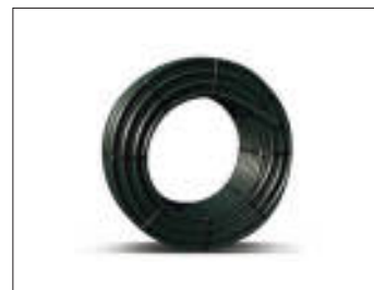
Tubo polietilene Polyethylene tubes Tubes en polyéthylène