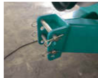
Occhione smontabile e regolabile Removable and adjustable tow-eye Tête d'attelage réglable et amovible