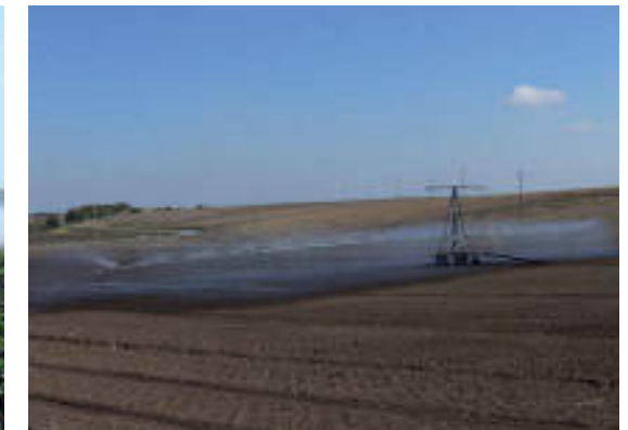
Ala piovana con cavi Spraying booms with support cables Rampe d'arrosage avec cables de soutien