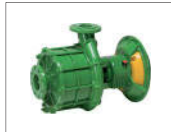
Pompa flangiata Flanged pump Pompe à bride