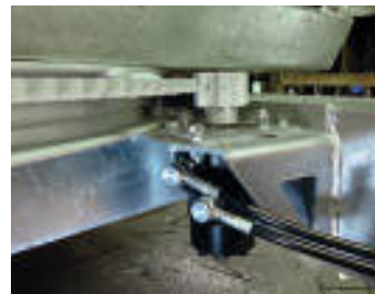
Rotazione idraulica Hydraulic rotation Rotation hydraulique