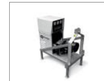
Gruppi elettrogeni a cardano PTO generating sets Groupes électrogènes Cardan