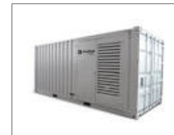
Gruppi elettrogeni in container Container generating sets Groupes électrogènes à conteneurs