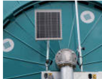
Pannello solare Solar panel Panneau solaire