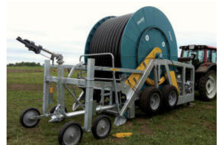
GHD INCORPORATA / INCORPORATED GHD / GHD ENCORPORÉS