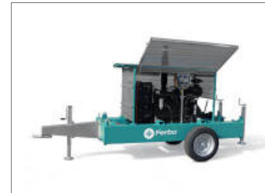
Motofrizione con tetto e rete Motor clutch set with roof and net Motofrictions motopompes avec toit et filet

Toutes les groupes sont personnalisable avec puissance et performance qui s'adaptent selon les nécessité d'utilisation ; pour cette raison Ferbo propose nombreux accessoires (panneaux de dernière génération, insonorisations totales ou partielles, système d'auto-amorçant, réservoirs d'haute capacité - jusqu'à 1.000 litres, complexe d'aspiration et refoulement, traitements spéciaux anticorrosifs). Au-delà des applications agricoles, Ferbo offre également des pompes pour autres applications (auto-amorçantes, industrielles, eaux usées, anti-incendie, etc).