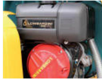
Motore ausiliario Auxiliary motor Moteur auxiliaire