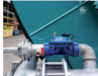
Idrovalvola di scarico Hydraulic outlet valve Vanne hydraulique de décharge