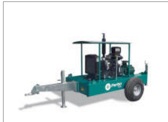
Motopompa con tetto 4-6 cilindri 4-6 cylinders motor pump with roof 4-6 cylindres motopompes avec toit

Les groupes motopompes sont devenues de plus en plus avancés, à partir d'un produit simple complémentaire pour les enrouleurs, jusqu'à devenir un produit indispensable pour les besoins du marché moderne. La demande pour ces produits est augmentée en manière exponentielle, ainsi que notre capacité productive et notre entière gamme. Ferbo offre une variété de combinaisons le plus complètes du marché, en utilisant des moteurs et des pompes des meilleures marques internationales.