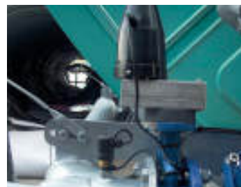
Elettrovalvola di chiusura lenta Slow closing electric valve Vanne électrique à fermeture lente