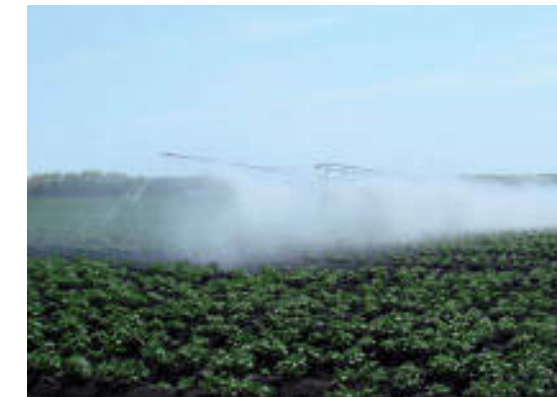
Ala piovana con tralicci Spraying booms with framework structure Rampe d'arrosage avec structure en treillis