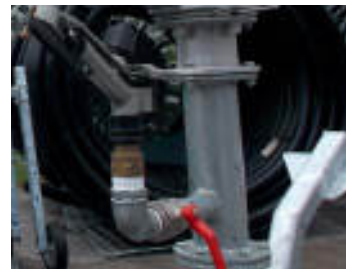
Kit secondo irrigatore sul carrello Second sprinkler on the trolley Deuxieme canon sur chariot