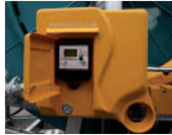
Computer gestionale Computer Boîte