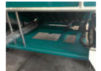
Telaio maggiorato e più robusto Bigger and stronger chassis Châssis majoré et renforcé

MARCHI MOTORI / ENGINE BRANDS / MARQUES MOTEURS