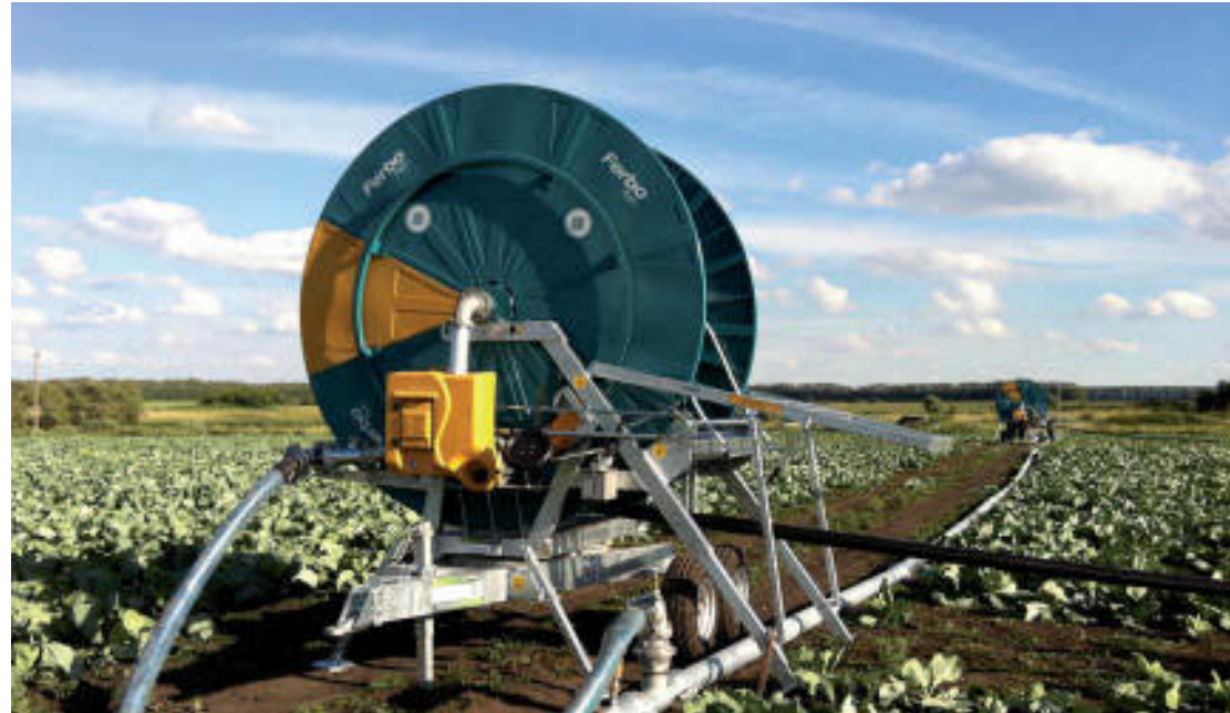
SERIE / SERIES / SÉRIES