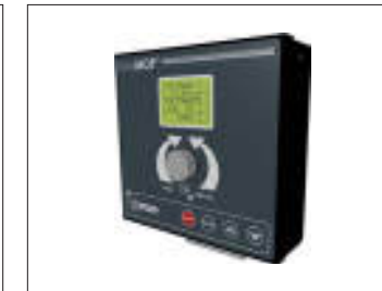
Centralina IdroMOP IdroMOP control panel Boîte IdroMOP