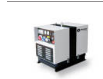
Gruppi elettrogeni 3000 RPM 3000 RPM generating sets Groupes électrogènes 3000 RPM

Ferbo, présente la marque Ferbo Energy pour la division groupes électrogènes. Ferbo Energy présente une gamme d'excellents systèmes qui répondent aux besoins d'énergie. Ces systèmes sont développés avec la recherche et haute technologie, et ils sont construits avec des matériaux de qualité. Ferbo personnalise les produits selon les spécifications du client.