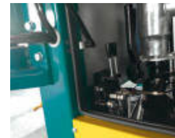
Leva di comando bandiera Control lever for suction arm Lever de contrôle pour le bras porte-tuyau d'aspiration