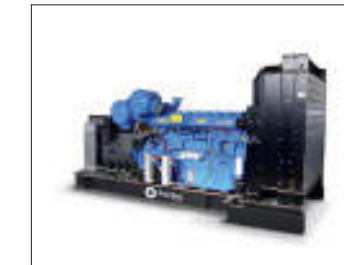
Gruppi elettrogeni aperti 1500 RPM 1500 RPM Open frame generating sets Groupes électrogènes à cadre ouvert 1500 RPM