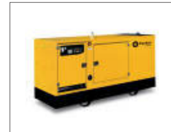
Gruppi elettrogeni insonorizzati 1500 RPM 1500 RPM Soundproof generating sets Groupes électrogènes insonorisés 1500 RPM