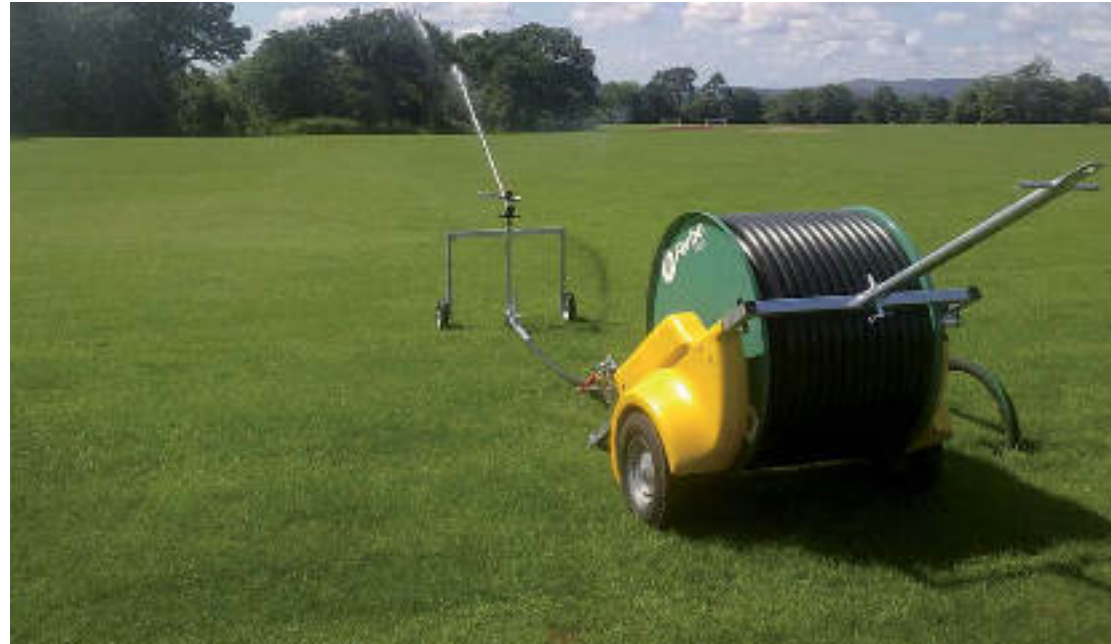
SERIE / SERIES / SÉRIES