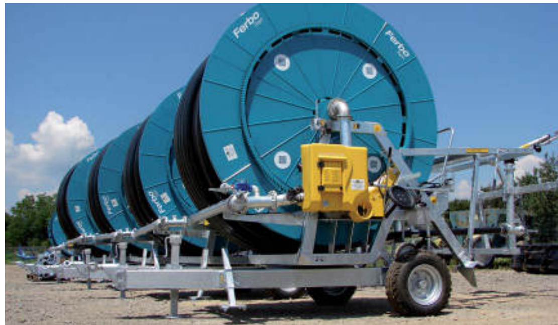
SERIE / SERIES / SÉRIES