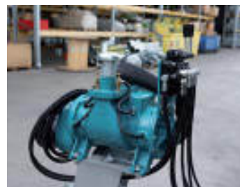
Compressore Compressor Compresseur