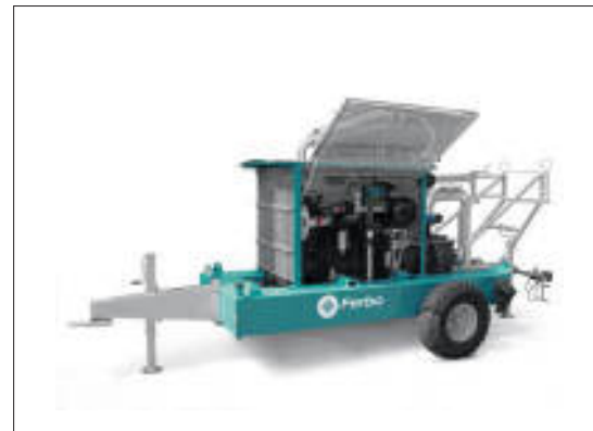
Motopompa con tetto e rete 4/6 cilindri 4-6 cylinders motor pump with roof and net 4-6 cylindres motopompes avec toit et filet