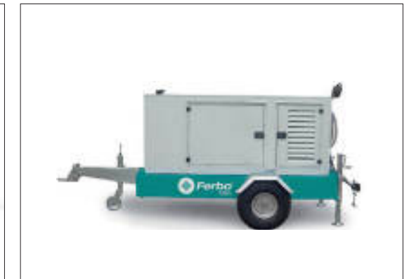
Motopompa interamente insonorizzata 4/6 cilindri 4-6 cylinders full silent motor pump 4-6 cylindres motopompes avec insonorisation complète