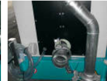
Collo di cigno fisso Fixed swan neck Col de cygne fixe