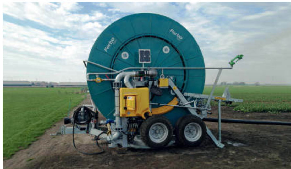
SERIE / SERIES / SÉRIES