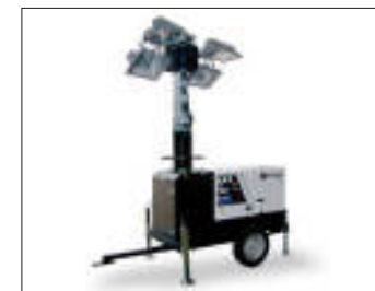
Tori faro Lighting towers Tours d'éclairage