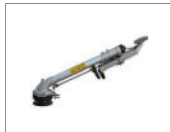
Irrigatore Irrigator Irrigateur