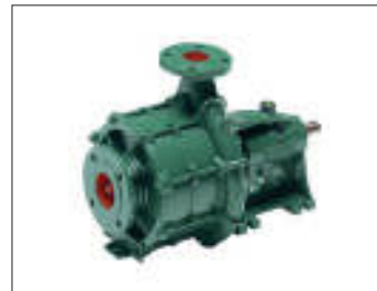
Pompa ad asse nudo Nude axle pump Pompe à axe nu

Afin de garantir aux clients un service à 360°, Ferbo propose une gamme complète d'équipements d'irrigation complémentaires; pompes, tuyaux galvanisés, tuyaux en aluminium, asperseurs, tuyaux en PET et en PVC.